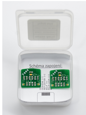
(a) Foto jednoho kusu čelního DPS