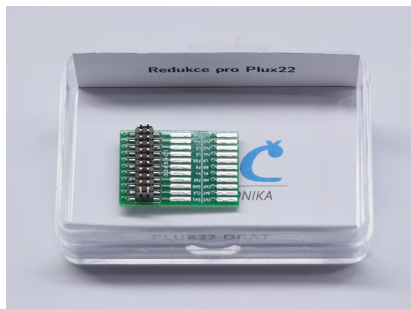
(a) Foto balení čelního DPS

Nesprávně připojené vodiče, které způsobí zkrat, mohou vést ke zničení dekodéru! Buďte proto velmi opatrní a důkladně spoje zkontrolujte!